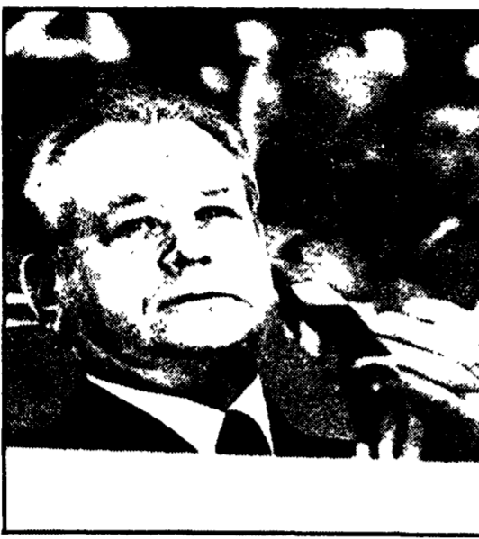
Il compagno Kirilenko alla tribuna del Congresso