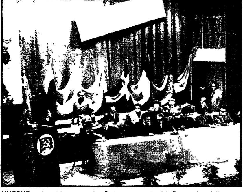
LIVORNO - Le delegazioni dei Partiti comunisti del Portogallo della Cambogia del Canada e dell'Irak hanno partecipato alla manifestazione svolta al teatro 4 Mar... Nella foto uno scorcio della presidenza