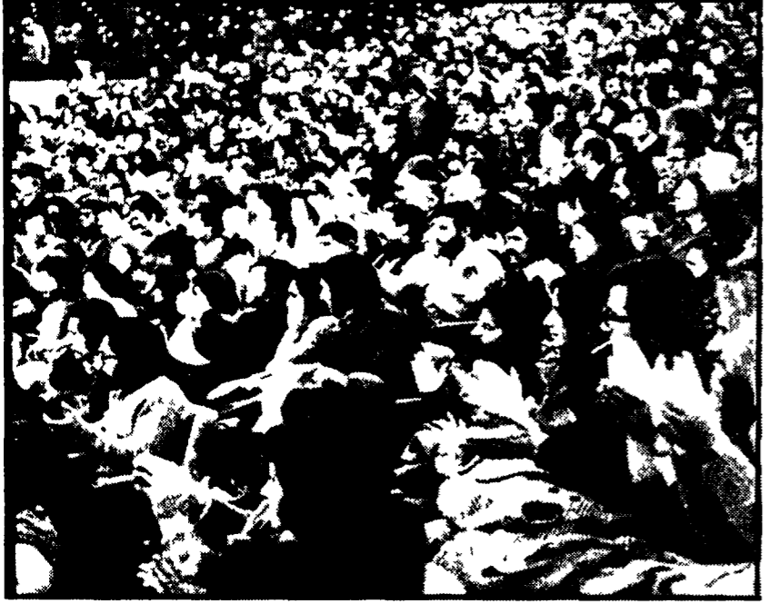
FIRENZE - Grande entusiasmo al Palazzo dei Congressi nel corso dell'incontro fra popolazione e delegazioni della SED dei Partiti comunisti rakeno e greco. Ha parlato la compagna socialista cilena Elba Vergara