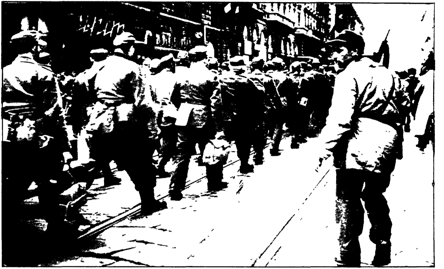
Soldati tedeschi prigionieri scortati dai partigiani in una strada di Milano, dopo la liberazione della città