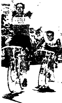
RIOLO TERME — La volata vincente di Moser, dietro il quale è Bitossi.