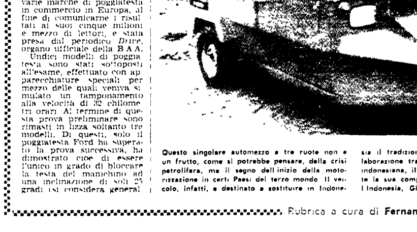
Questo singolare automezzo a tre ruote non è un frutto, come si potrebbe pensare, della crisi petrolifera, ma il segno dell'inizio della motorizzazione in certi Paesi del terzo mondo.