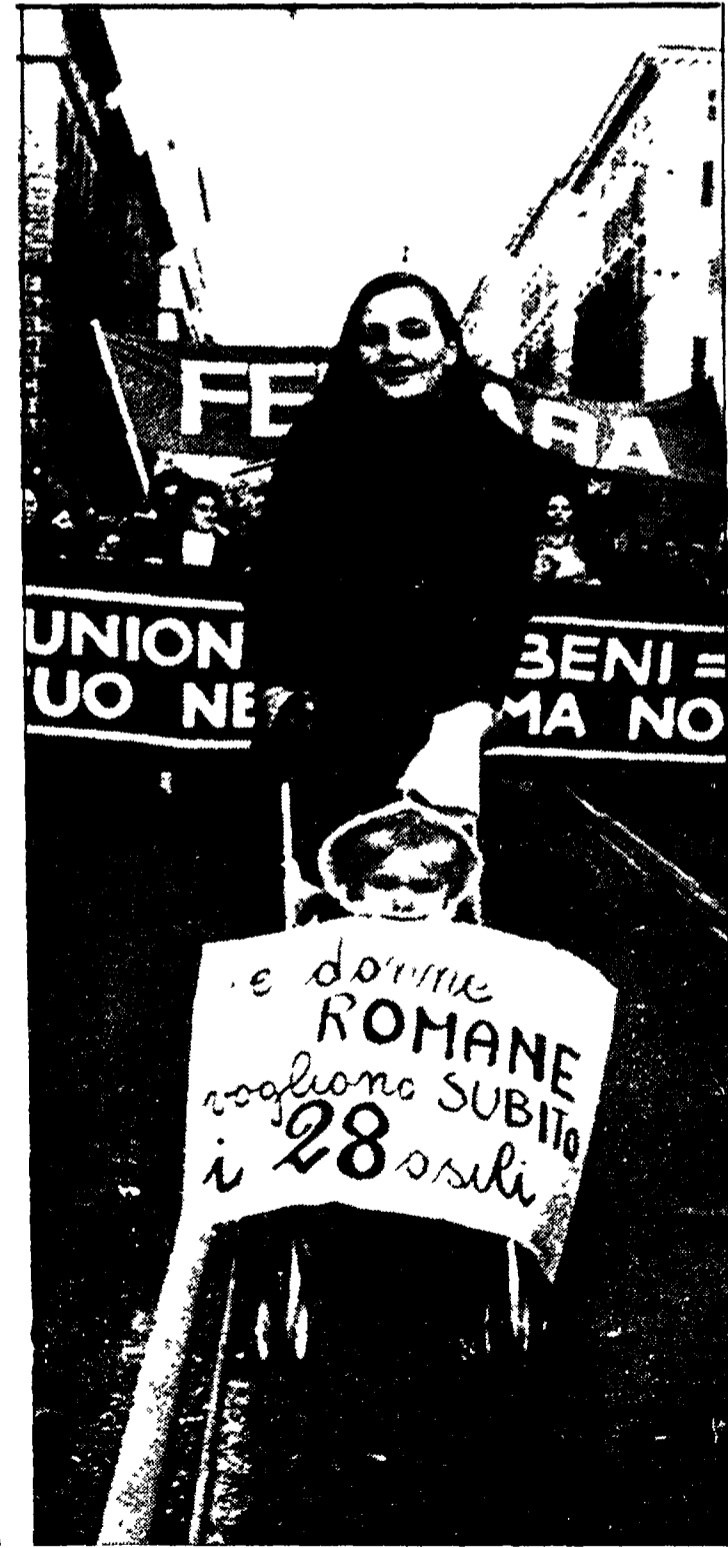
Roma 13 novembre 1974 un momento della grande manifestazione indetta dall'UDI per sollecitare l'approvazione del diritto di famiglia...