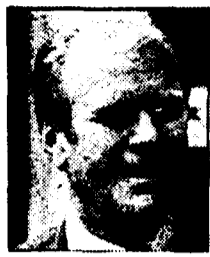
GERALD FORD - «Serrare le file»