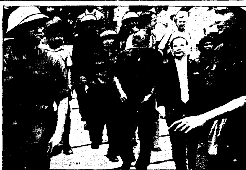
Proseguono a Saigon liberata, e ribattezzata Città Ho Chi Minh, i provvedimenti volti a normalizzare la vita quotidiana...