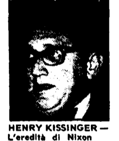
HENRY KISSINGER - «L'eredità di Nixon»