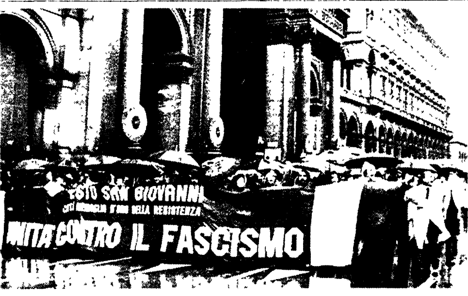
MILANO — Decine di migliaia di cittadini democratici, giovani, partigiani, perseguitati politici, reduci dai campi di concentramento... (A PAGINA 4)

DALL'INVIATO STRESA, 4 maggio. Iniziato in sordina e distorto... (A PAGINA 4)