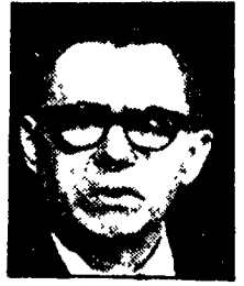
GROMIKO — «Ferma adesione»

Unione Sovietica e Stati Uniti «hanno unanimemente sottolineato la loro determinazione di mantenere ferma ad ogni costo...»