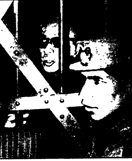
Bolivia: processo al capo della Guif