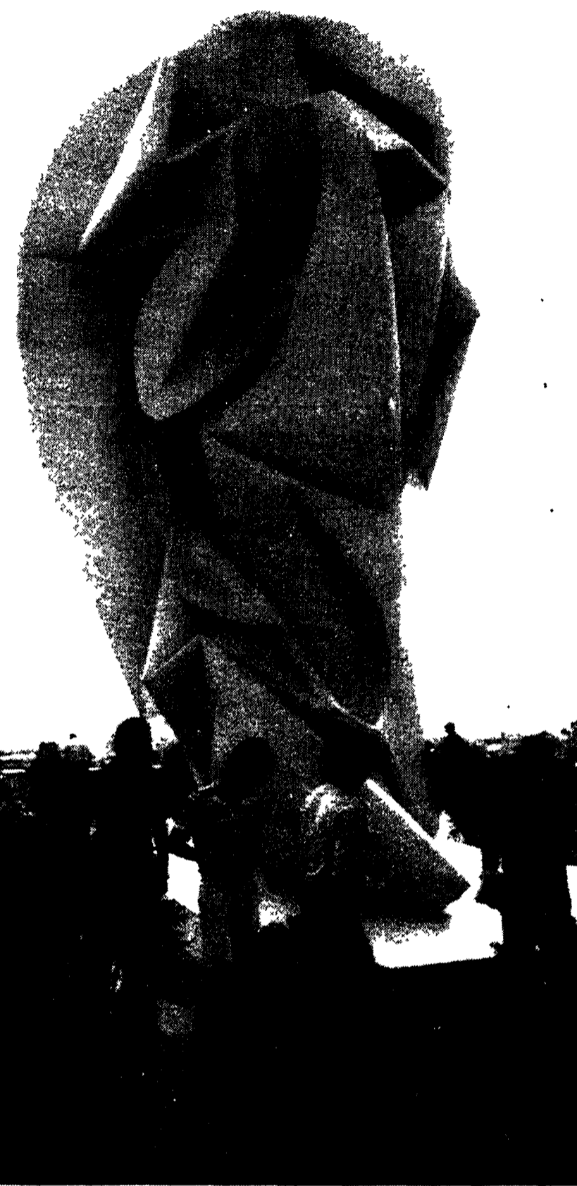
Le « Grandi pieghe al vento », 1971-'74. La scultura, in resina poliesterica, alta undici metri, è stata collocata sulla terrazza del Pincio.