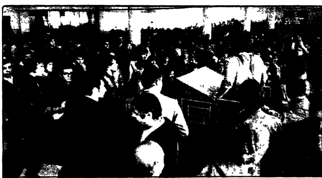
MILANO - L'assemblea dei lavoratori della OM-FIAT dopo la grave provocazione poliziesca e padronale

Pesante situazione del lavoro e della produzione nella capitale lombarda