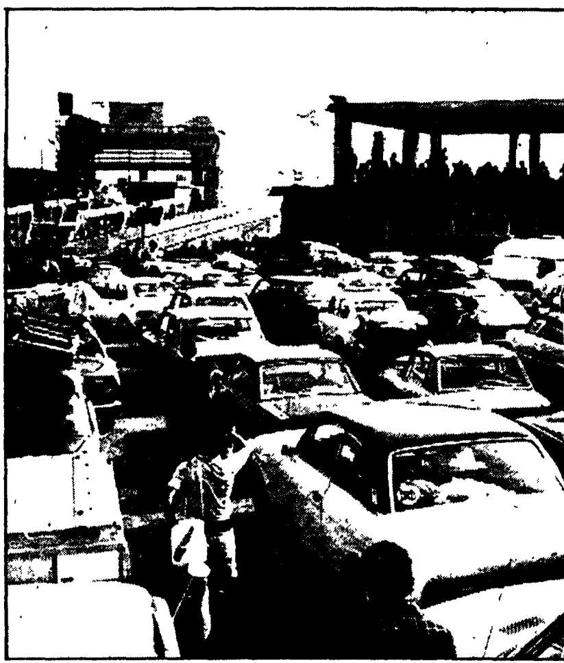
Lunga fila di auto all'imbocco dei traghetti per la Sardegna a Civitavecchia

Chi ha in mente di trascorrere le vacanze nell'isola dovrà rassegnarsi a lunghissime code nel porto di Civitavecchia al momento dell'imbarco e affidarsi alla fortuna - Carenze e ritardi che portano direttamente alle responsabilità di una parte della direzione delle Ferrovie dello Stato - «Un problema che riguarda gli orientamenti e le scelte», dicono i sindacati