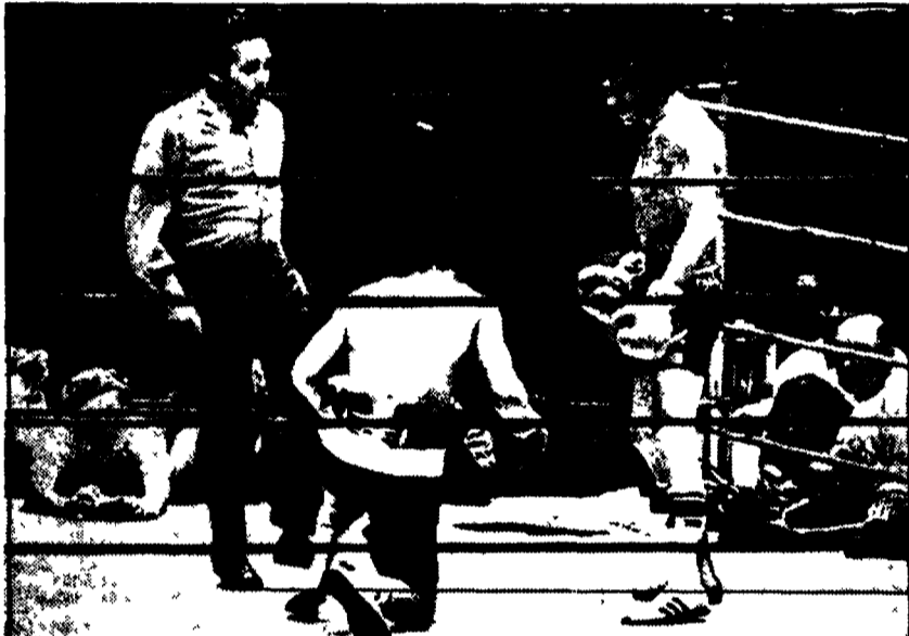
Due fasi dei mondiali di ieri. In alto: Ali attacca Bugner di sinistro nel match di Kuala Lumpur. Sotto: l'epilogo di Monzon-Licata; lo sfidante è in ginocchio per la seconda volta e l'arbitro si appresta a decretare il K.O.T.