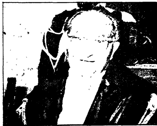
Il magistrato calabrese Francesco Ferlino

Una organizzazione che è cresciuta e invade quasi ogni campo dell'attività criminale - In questo groviglio (aveva messo mano) l'avvocato generale Francesco Ferlino - Le indagini, le ipotesi, le sconcertanti conclusioni - Ritrovata l'auto dell'agguato? - Due arresti in provincia di Cosenza