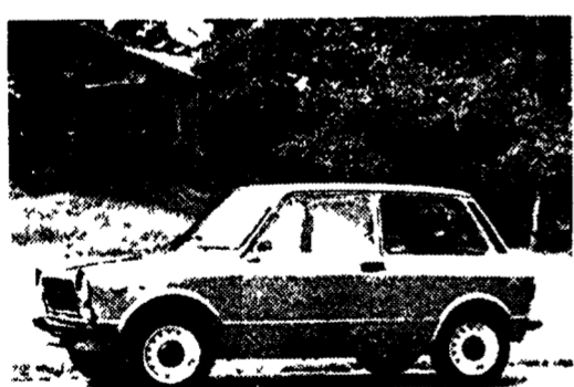
Così si presenta la versione semplificata della «A 112»

Con le modifiche meccaniche si è ottenuta una riduzione dei consumi - Semplificato anche l'allestimento interno