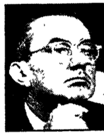
COLBY - Gli intrighi della CIA