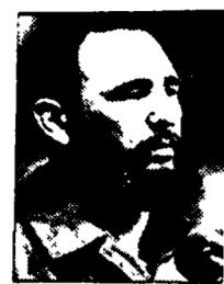
CASTRO - Una sfida vincente