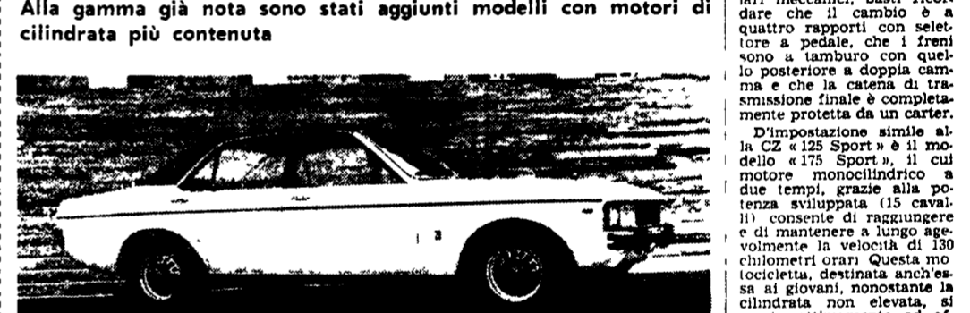
Una delle nuove Ford « Granada » con motore di cilindrata ridotta.

Alla gamma già nota sono stati aggiunti modelli con motori di cilindrata più contenuta.