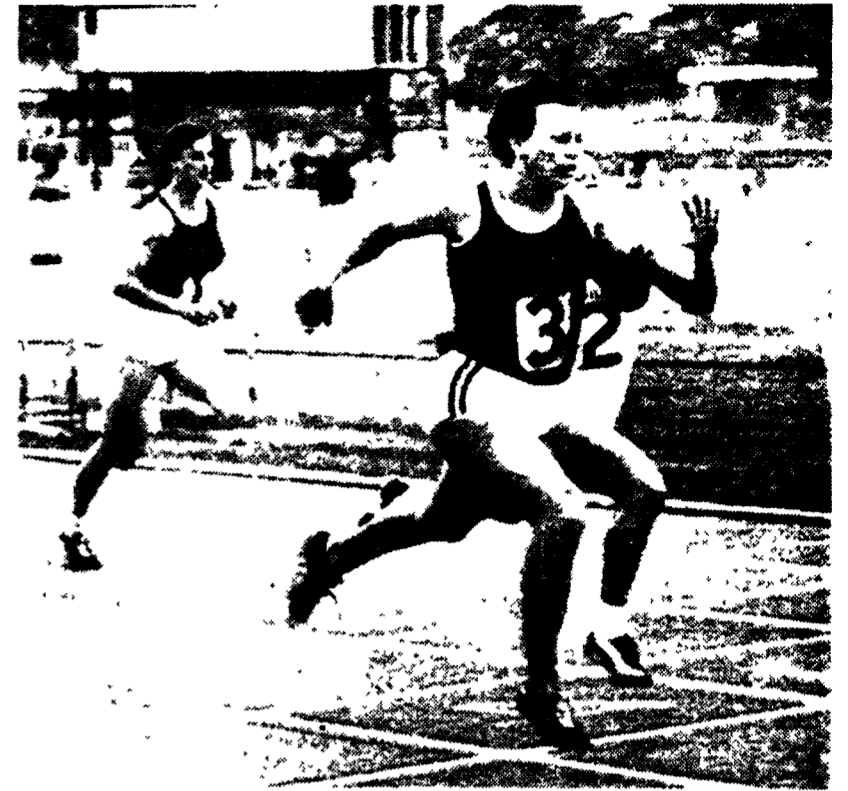
Del Forno, Kozakiewicz e la Stecher: tre protagonisti dell'atletica '75 Del Forno (foto a sinistra), specialista del salto in alto (stile ventrale), quest'anno ha fatto il record italiano a 2,21 e ha vinto la preolimpica a Montreal Kozakiewicz (al centro), primatista europeo con 5,60, e uno dei tanti atleti prodotti dalla straordinaria scuola polacca del salto con l'asta. Renate Stecher-Meisner (a destra) l'altr'anno ha ceduto lo scettro di miglior velocista alla polacca Irena Szewinska. Quest'anno pare intenzionata a tornare la migliore di tutte.