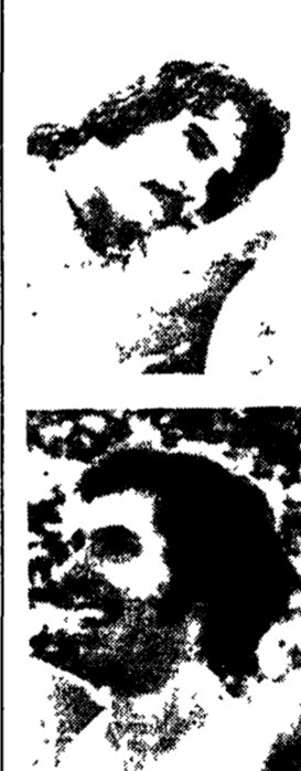
Nella foto in alto Remo Musumeci. Nella foto in basso Remo Musumeci.