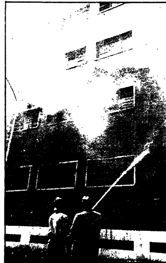
Colonne di fumo si levano dalle finestre della Manifattura Tabacchi. A destra: una parte delle tonnellate di sigarette andate distrutte

Il gruppo consiliare del Pci alla Regione è convocato oggi alle ore 12 nella sede in piazza SS. Apostoli.