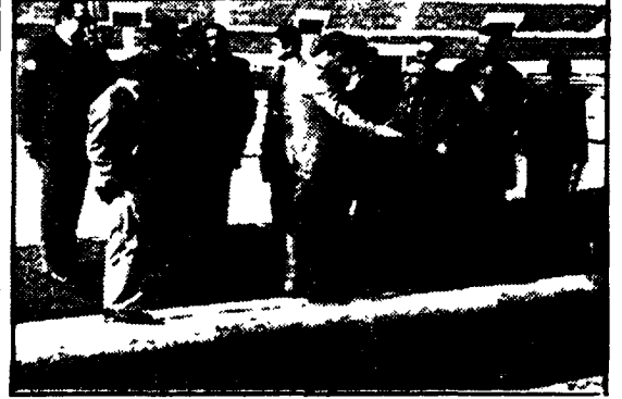
Uno dei tanti sopralluoghi all'Olimpico

Una fila di posti in meno - Insoluto il problema del «tunnel» per l'ingresso dei giocatori