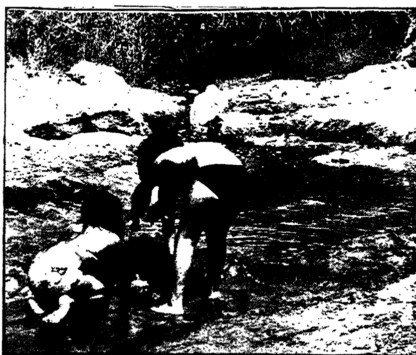
Il litorale di Lavinio popolato di bagnanti, domenica scorsa. A destra, dove il mare è ancora sporco: bambini giocano in una pozza formata sulla spiaggia da un rigagnolo di liquami nei pressi di Torvalanica

A black and white photograph capturing a busy scene on a beach. A large, dense crowd of people is gathered along the shoreline, many looking towards the water. In the center of the frame, a small, dark-colored boat is being pulled up the beach by several individuals. The boat has some text on its side, which appears to be "WHEEL BEAT". The background is dominated by a steep hillside covered with numerous small, closely packed buildings, creating a terraced effect. The overall atmosphere suggests a significant event or a busy day in a coastal community.