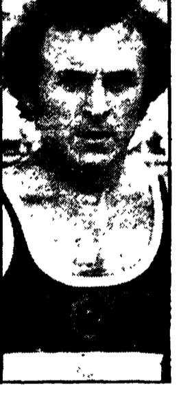
Le gara del cento metri al meeting atletico di Zurigo dove aveva la rivincita tra il sovietico Pietro Mennea e l'azzurro Pietro Mennea.

Il due nella gara del campionato europeo a Nizza col tempo di 1'04"40, conclusa praticamente in parità. Dopo aver esaminato il film della vittoria venne assegnata la medaglia d'oro a Mennea, il successo di Pietro nel 200 venne a riaccredere le speranze del campione italiano. Mennea rimase l'amarazza di aver perso l'occasione buona per superare il record di Pietro nel 200 metri. Il successo di Pietro nel 200 venne a riaccredere le speranze del campione italiano. Mennea rimase l'amarazza di aver perso l'occasione buona per superare il record di Pietro nel 200 metri.