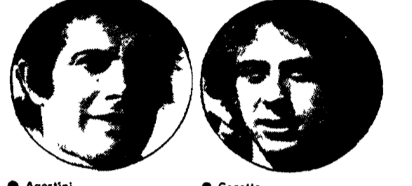
● Agostini ● Cecotto

Il Gran Premio di Cecoslovacchia ultima e decisiva prova per la classe 500 - Nelle 350 a Cecotto basterà piazzarsi per conquistare il suo primo «mondiale»