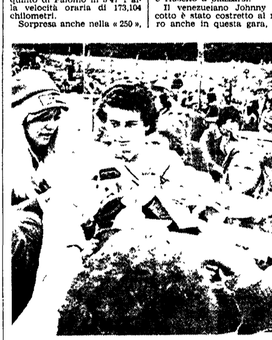
Johnny Alberto Cecotto, neo-iridato nella 350 cc, festeggiatissimo dal fans.