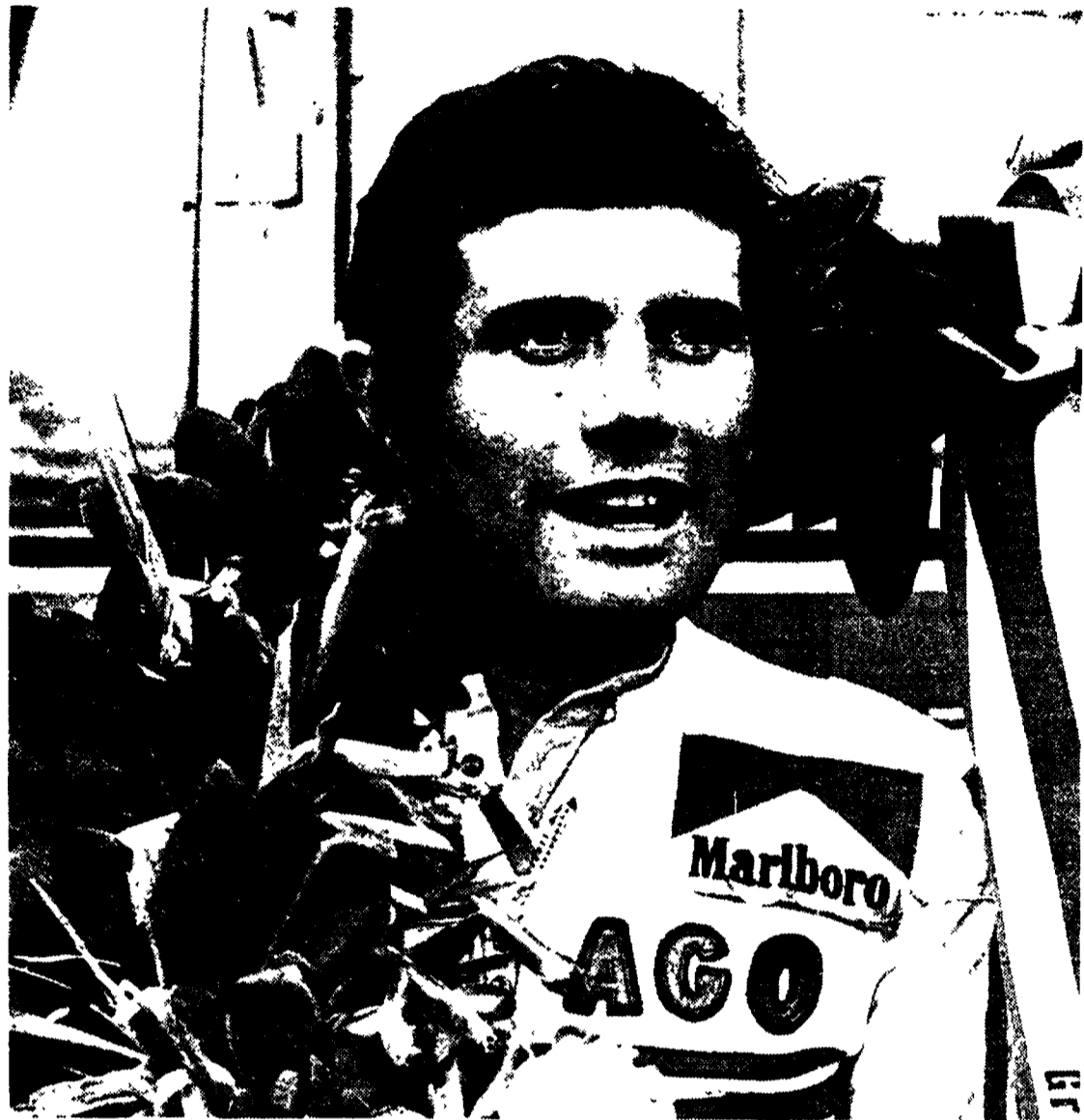
Giacomo Agostini, campione del mondo per la quindicesima volta.

Nelle mezzo litro inutile successo di Read, nelle 350 catena di ritiri