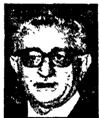
LEONE: verso il messaggio alla Camera?