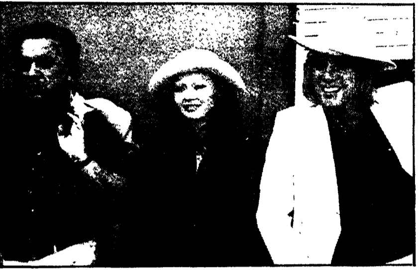
Federico Fellini coi due protagonisti del suo «Casanova»

Basata solo su supposizioni l'ipotesi di una vendetta maturata nell'ambiente del cinema — I tecnici della casa cinematografica stanno lavorando per tentare di ricostruire in laboratorio i negativi trafugati