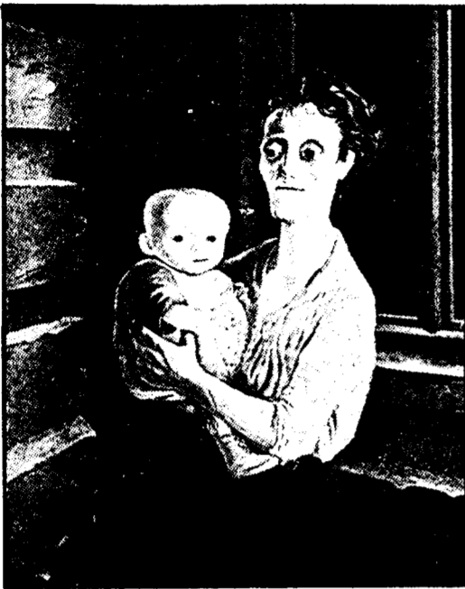
OTTO DIX: « Donna con bambino », 1921.