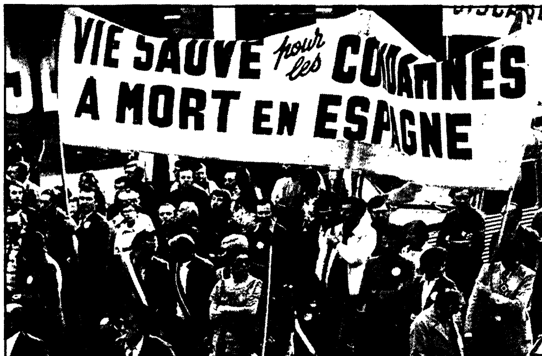
PARIGI - Un'immagine della possente manifestazione di sabato contro le condanne a morte dei patrioti spagnoli

Ieri manifestazioni a Firenze e Parma - Iniziativa unitaria degli amministratori del Piemonte - Un appello del card. Pellegrino - Prese di posizione della Giunta regionale lombarda, del Consiglio veneto, della Provincia di Venezia, di sindacati - Boicottaggio agli aerei diretti e provenienti dalla Spagna - Espulsa da Madrid una delegazione di personalità francesi