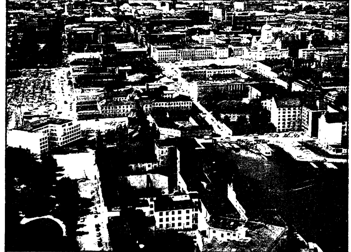
Un'immagine aerea del centro della capitale finlandese, Helsinki