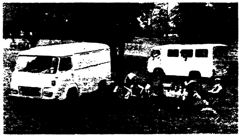
I SAVIEM SG2 Bertone nelle versioni furgone, in primo piano, e veicolo promiscuo.

Si tratta di due furgoni da 10 e da 13 quintali e di un furgone per uso promiscuo - Buon compromesso fra funzionalità ed estetica - Il propulsore è il Saviem 712 Diesel