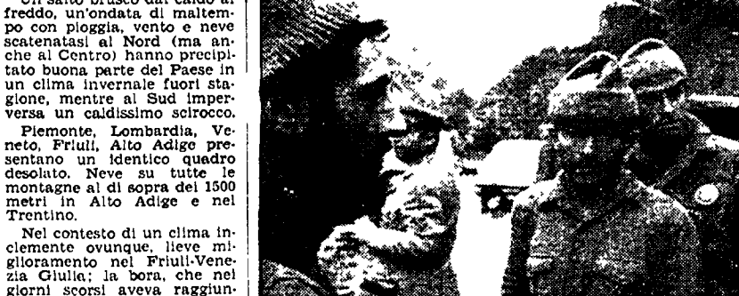
DOMODOSSOLA - Una squadra di soccorso rientrata dopo il salvataggio degli «scouts»

Sono stati ritrovati tutti salvi e in buone condizioni i ventiquattro «boy-scouts» dispersi sulle montagne di Domodossola - Neve su tutte le montagne al di sopra dei 1500 metri