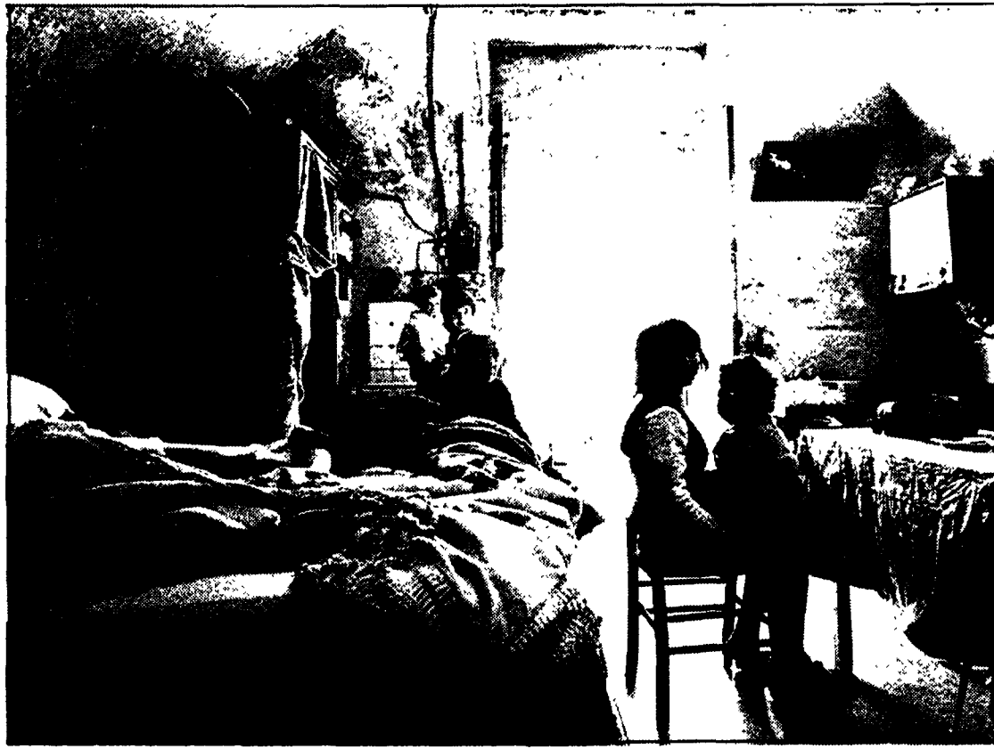
L'interno di un «basso» a Napoli