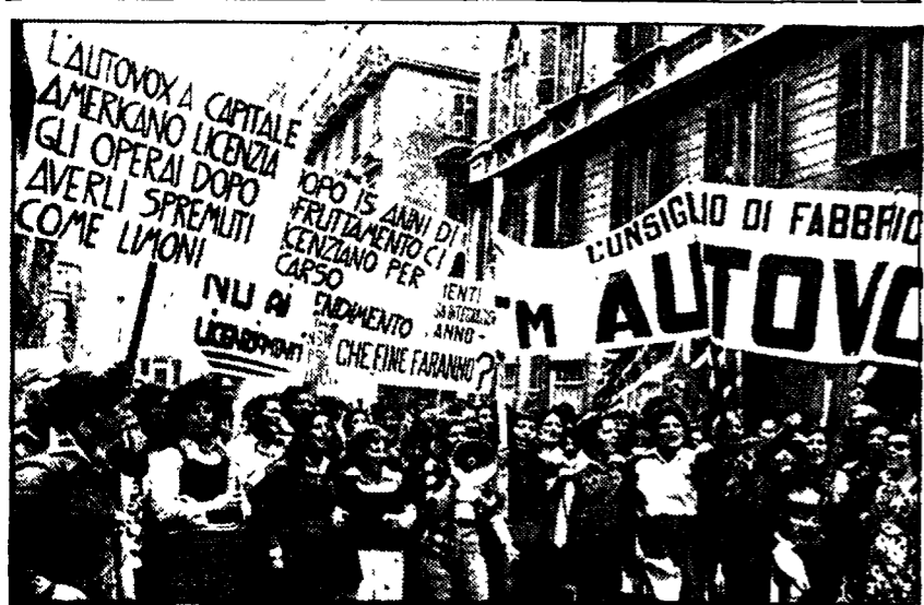
Una recente manifestazione dei lavoratori dell'Autovox

Definita la questione del consorzio dei trasporti - Sull'assetto degli enti regionali la DC chiede un rinvio per riesaminare il problema - Una dichiarazione del compagno Ciofi - « Occorre dar corso alle intese raggiunte »