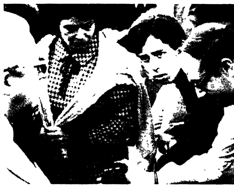
MADRID - Cittadini madrileni sostano a gruppi nei pressi del Pardo in attesa di notizie sulla vita del dittatore.

Dopo l'attacco dell'esponente doroteo a Zaccagnini in nome della «centralità»