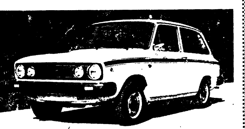
Così si presenta la Volvo 66 nella versione GL. Nelle foto del titolo: a sinistra, un particolare del cruscotto con il volante di nuovo disegno e la ricca strumentazione; a destra una vista posteriore della vettura con le tre porte aperte e con i sedili posteriori abbattuti per realizzare un piano di carico di m 1,35 x 1,25. Nella Volvo 66 il bagagliaio è munito di un pannello amovibile che consente di celare il carico. La più piccola della Volvo è venduta (IVA compresa) a 2.889.600 lire nella versione 66 DL con motore 1100 e a 2.990.400 lire nella versione GL con motore 1300.

La Volvo Italia ha dato il via alle vendite sul nostro mercato della Volvo 66 che viene così ad essere il modello al livello di cilindrata più basso della gamma. Si tratta infatti di una vettura equipaggiata con un motore di 1108 cmc nella versione Volvo 66 GL e con un motore di 1289 cmc nella versione Volvo 66 DL.