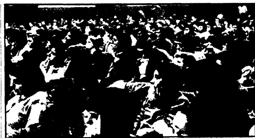
Un particolare della sala del cinema Palazzo durante il congresso della FGCI

In due giorni, più di quaranta interventi hanno animato un dibattito vivo, ampio, articolato: il congresso provinciale della FGCI al cinema Palazzo, a San Lorenzo, termina oggi, con le conclusioni del segretario nazionale Renzo Imbeni. Dalle prime giornate di lavoro emerge il dato della crescita, della nuova maturità razionale dell'organizzazione dei giovani comunisti romani. Nel dibattito, ieri, sono intervenuti il compagno Gerardo Chiaromonte della segreteria nazionale del PCI, e Massimo D'Alema, della direzione nazionale della FGCI. Gli interventi della FGCI di fronte all'acuità e alla gravità della crisi economica, per dare risposte alle esigenze, ai bisogni, alle spinte delle nuove generazioni? Innanzitutto — è stato sottolineato — è necessario sviluppare una lotta iniziata sui temi della disoccupazione, superando anche i ritardi, e segnando l'azione dei giovani comunisti. In questo senso — ha ad esempio sottolineato il compagno Augusto Petrilli — occorre che la FGCI discuta meglio sul nuovo modello di sviluppo economico, affronti il problema delle scelte della riconversione produttiva, degli investimenti nel Mezzogiorno, del bilancio dell'agricoltura, sul quale forse, l'elaborazione è stata, ed è, troppo generica.