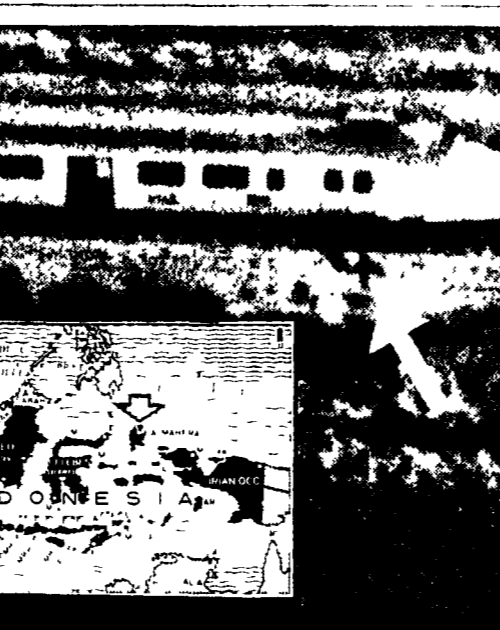
Il treno sequestrato degli indipendentisti delle Molucche. Indicato dalla freccia, sulla macchinista, è visibile il corpo di un uomo, gettato dal finestrino dopo essere stato ucciso.