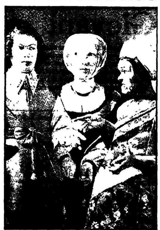
Una splendida monografia dell'opera completa del pittore francese Georges de La Tour (1658-1692) è uscita per i tipi di Electa editrice...