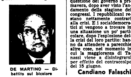
DE MARTINO - Dibattito sul bicolore