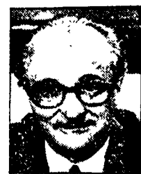
NATTA - Parlamento e referendum