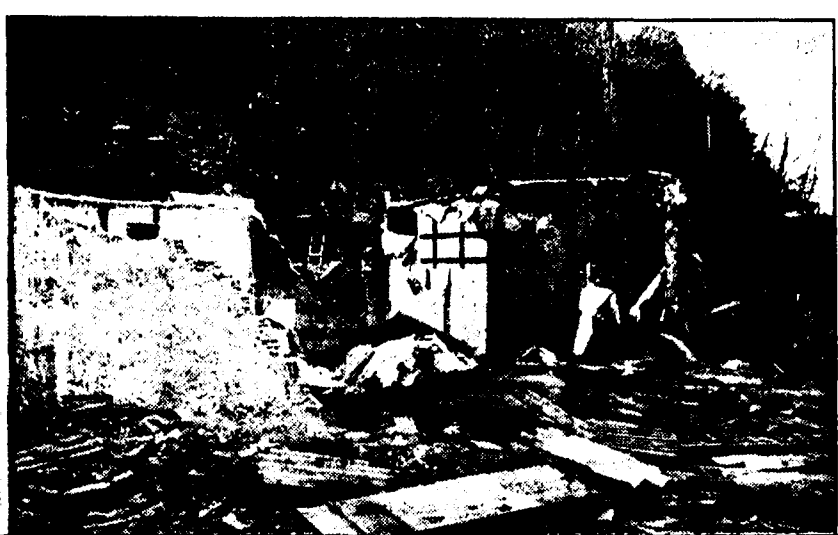
I resti di una casupola abbattuta dagli ex senzatetto della Circonvallazione Salaria

Avvisi di reato per truffa — La somma bloccata in banca — Implicati funzionari dello Stato e due assessori regionali che hanno autorizzato il mutuo — La denuncia della Federbraccianti