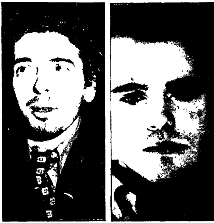
«Collettivo di fisica»: un gruppo provocatorio nato nella crisi dell'ateneo