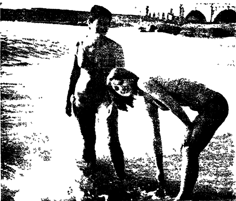
GENOVA — Mentre su tutta l'Alta Italia incombe una fitta coltre di nebbia e il termometro segnava valori vicini a zero, la riviera ligure beneficia di una mitige temperatura di cui hanno approfittato alcune bagnanti decisamente « fuori stagione ».

Folle di giganti hanno affollato le stazioni turistiche e le banchine portuali per i tradizionali viaggi alle isole - Un ragazzo attraversa i binari a San Donato Milanese e viene ucciso da un rapido