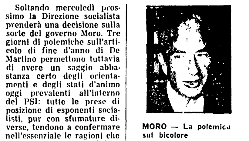
MORO - La polemica sul bicolor