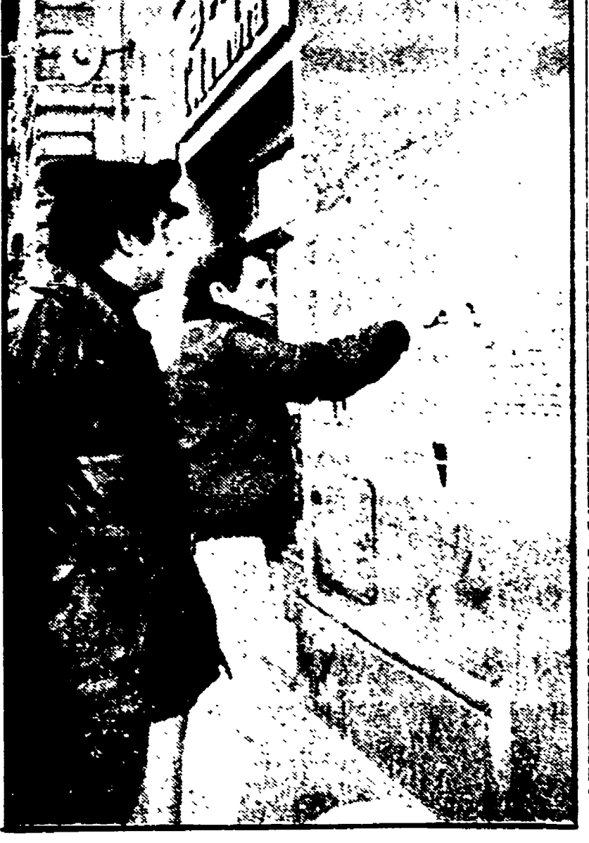
Ieri mattina, per iniziativa dell'assessorato alla Polizia Urbana, alcuni operai del Comune hanno iniziato il lavoro di ripulitura dei muri dove abusivamente erano state verniciate delle scritte ed erano stati affissi manifesti. Nella foto: uno dei tanti operai del Comune, mentre imbianca le pareti di uno dei palazzi del centro

Si decide sul giovane che si dichiara innocente