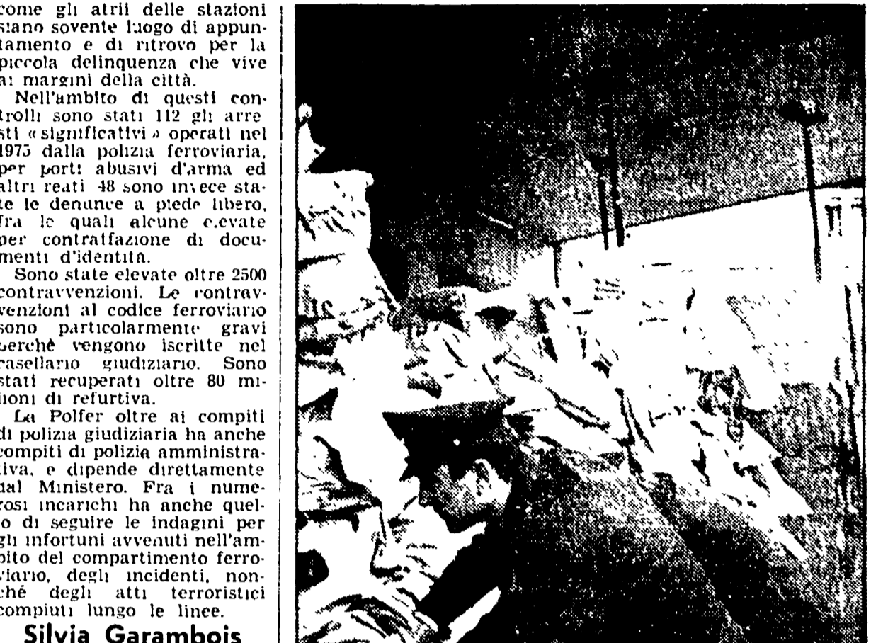
Agenti della Polfer nel corso dei controlli dei carrelli della posta alla stazione di S. M. Novella - Compito principale degli uomini della polizia ferroviaria è quello della salvaguardia del patrimonio e la protezione del personale ferroviario e dei viaggiatori - I continui e numerosi allarmi che minacciavano bombe sulle linee ferroviarie hanno spesso distolto la Polfer dal suo lavoro e dal suo incarico

Il centro turistico sportivo di Firenze - piscina Costoli - in Campo di Marte comunica che sono appena iniziati i corsi di nuoto del terzo turno trisettimanale. Le iscrizioni restano ancora aperte fino al 23 gennaio dalle ore 15 alle ore 18 di tutti i giorni feriali - telefono 675.744.