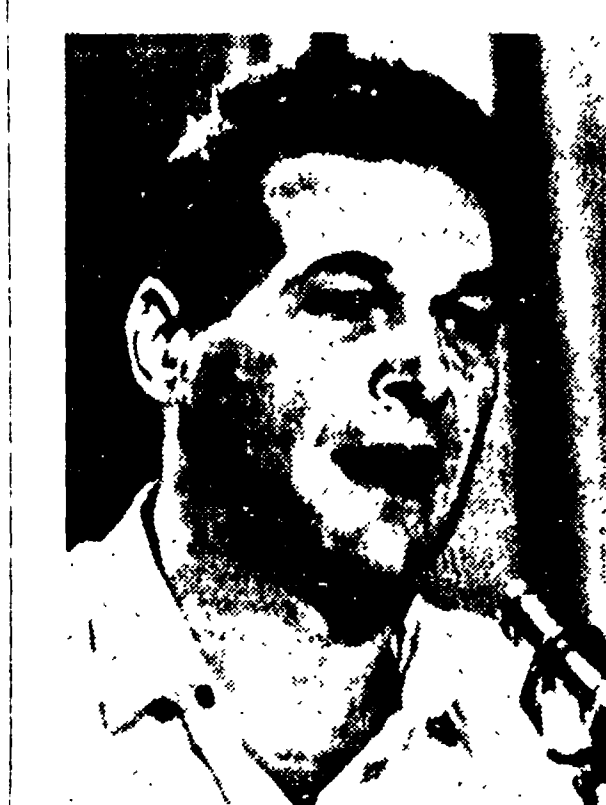
Il compagno Luciano Lama

Concluderà i lavori della riunione dei consigli regionali CGIL-CISL-UIL