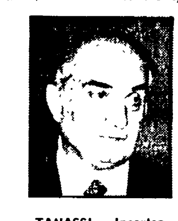
TANASSI - Incercezza e irritazioni