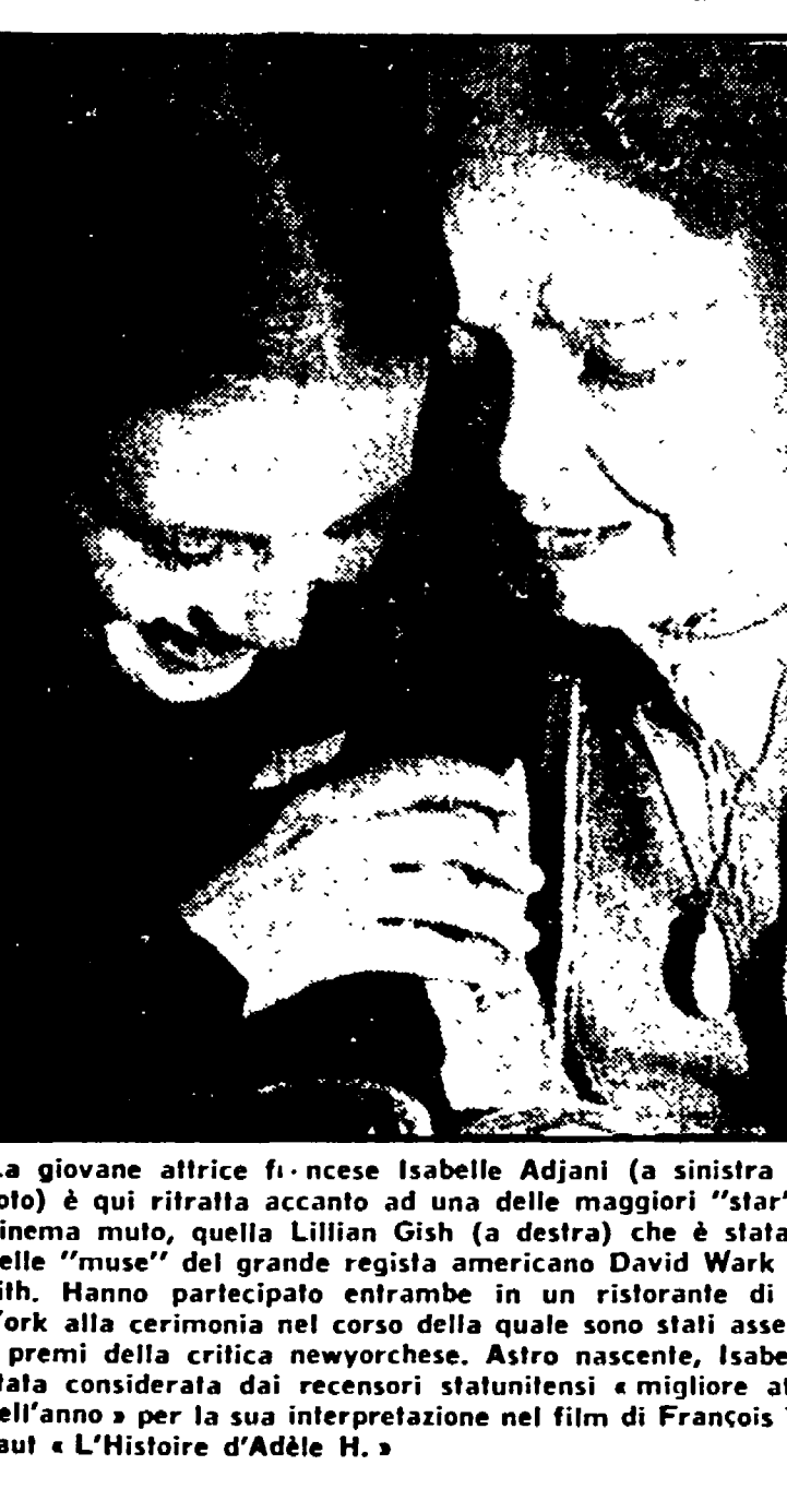
La giovane attrice fi-nese Isabella Adjani (a sinistra nella foto) è qui ritratta accanto ad una delle maggiori "star" del cinema muto, quella Lillian Gish (a destra) che è stata una delle "muse" del grande regista americano David Wark Griffith.