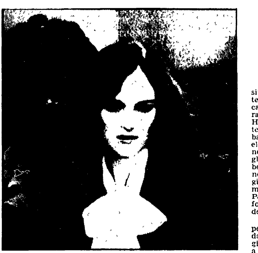
Pat' Hearst davanti ai giudici