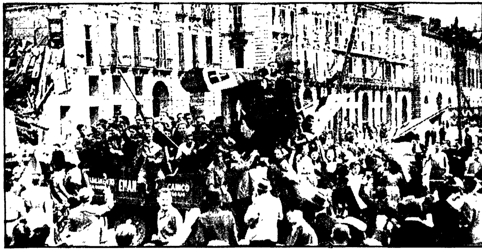
Manifestazione a Torino per la caduta del fascismo il 25 luglio 1943

Una riflessione storica e politica, carica di spunti attuali, che nasce dalle esperienze di lotta accumulate dalle forze popolari negli ultimi 50 anni