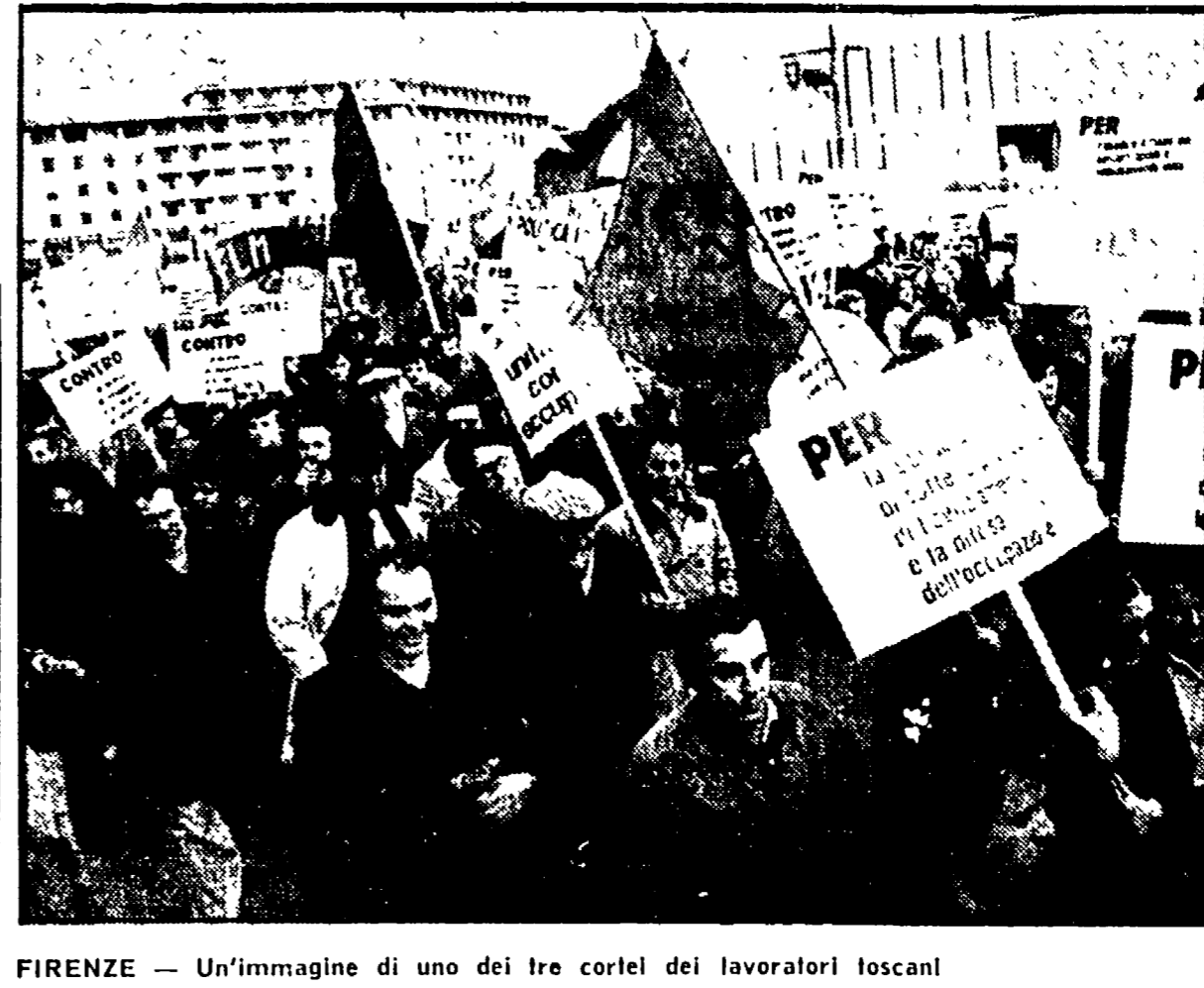
FIRENZE — Un'immagine di uno dei tre cortei dei lavoratori toscani