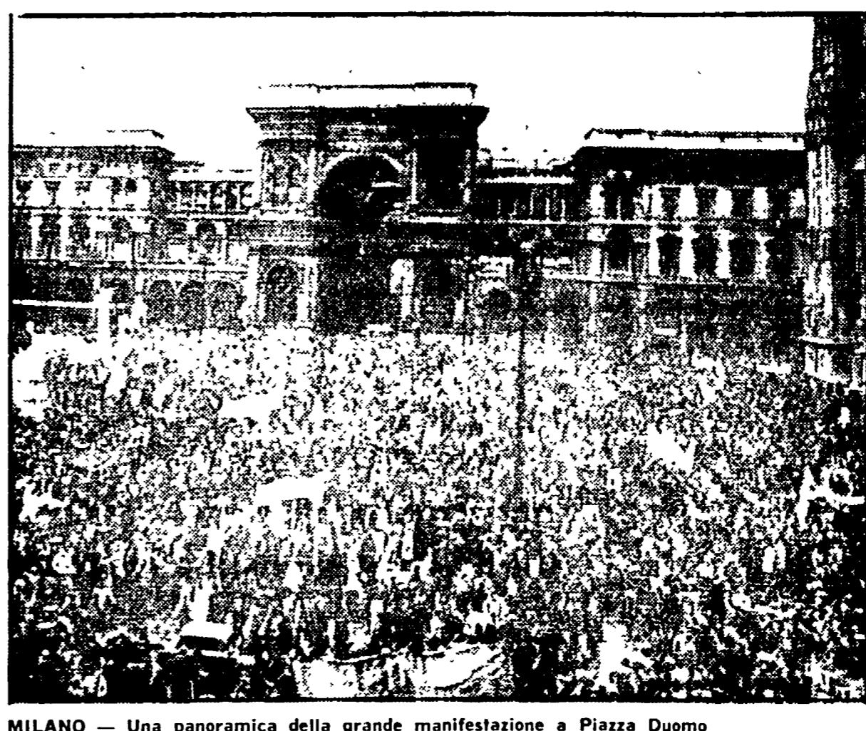
MILANO — Una panoramica della grande manifestazione a Piazza Duomo