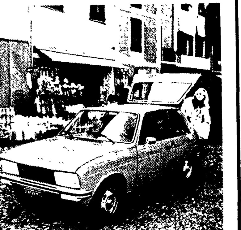
Il coupé Peugeot «104 ZS» consente anche una buona capacità di carico con l'abbattimento dei sedili posteriori. Nella foto sopra il titolo due particolari dell'abitacolo e della strumentazione.